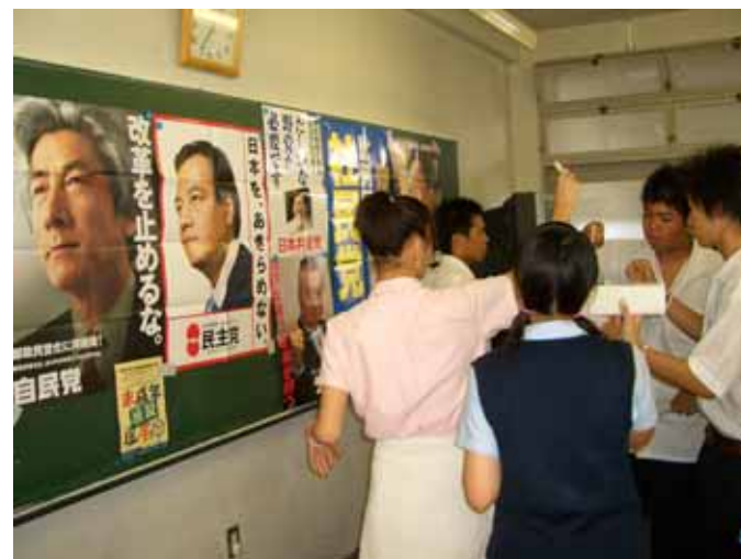
学校投票@玉川学園高等部